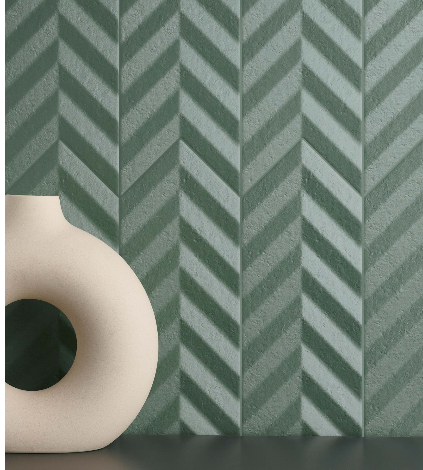
● FOLD GREEN/15X38