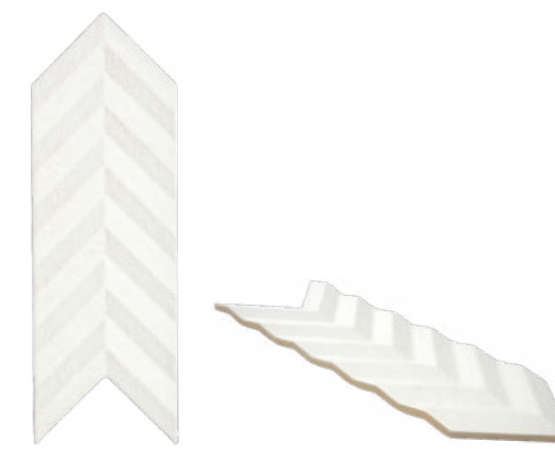
37885 FOLD WHITE/15X38 H48 (15x38 cm — 5 15 / 16 x 14 15 / 16 "*) *100 Mapei