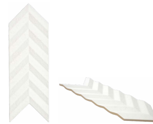
37885 FOLD WHITE/15X38 H48 (15x38 cm — 5 15 / 16 x 14 15 / 16 "*) *100 Mapei