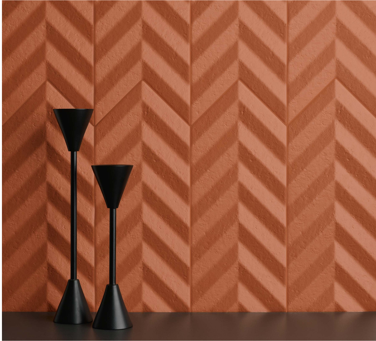
● FOLD CLAY/15X38